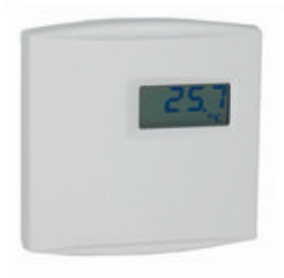
fig. 1. Verdrahtungsdiagramm