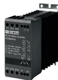
fig. 1. Verdrahtungsdiagramm