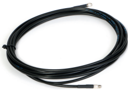
fig. 1. Montage

"..." Bitte die Kabellänge zur Vervollständigung der Produktangabe wählen Weitere Kabellängen auf Anfrage, bitte kontaktieren Sie unseren Support unter support@comatreleco.com.