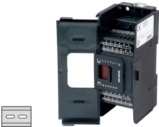
fig. 1. Abmessungen (mm)