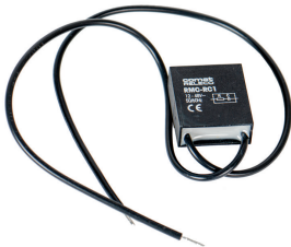
fig. 1. Abmessungen (mm)