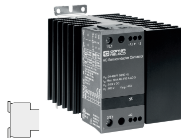
fig. 1. Verdrahtungsdiagramm