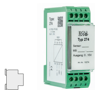
fig. 1. Abmessungen (mm)