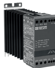
fig. 1. Verdrahtungsdiagramm