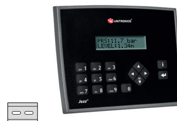
fig. 1. Abmessungen (mm)