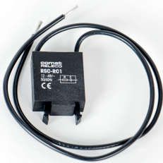
fig. 1. Abmessungen (mm)