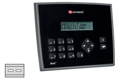
fig. 1. Abmessungen (mm)