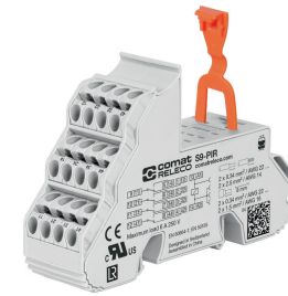
fig. 1. Verdrahtungsdiagramm