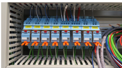
Mit der neuen ComatReleco Sockelfamilie wird die Installation platzsparender und übersichtlicher.

Mit ComatReleco wird die Bestückungsdichte im Schaltschrank massiv gesteigert und der entstehende Reserverplatz kann umfassender genutzt werden.