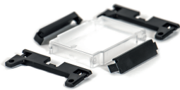
fig. 1. Abmessungen (mm)